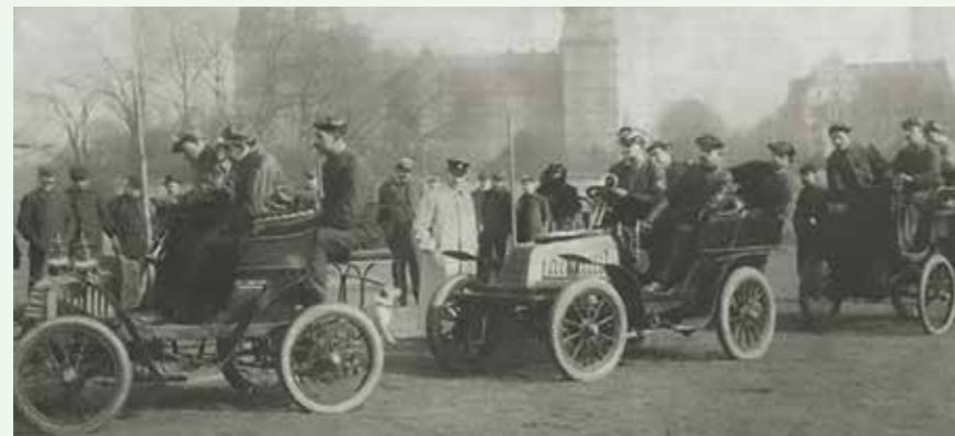
Die erste deutsche Autolenkerschule (1906)

Der Begriff Automobil leitet sich ab von griechisch αὐτός ( autos , deutsch: ‚selbst‘) und lateinisch mobilis (deutsch: ‚beweglich‘) und diente ursprünglich lediglich zur Unterscheidung zwischen Motorfahrzeugen und Fuhrwerken bzw. Kutschen. In diesem Artikel ist damit, wie in der in der Alltagssprache gebräuchlich, der Personenwagen gemeint. Die Geschichte des Automobils im engeren Sinn begann im 19. Jahrhundert. Obwohl bereits seit Anfang des 19. Jahrhunderts verschiedene Dampfkraftwagen und Dampfomnibusse und ab 1881 auch schon Elektroautos gebaut wurden, gilt das Jahr 1886 mit dem Benz Patent-Motorwagen Nummer 1 als Personenkraftwagen mit Verbrennungsmotor des deutschen Erfinders Carl Benz als Geburtsjahr des Automobils. Im Jahr 1900 wurden in den Vereinigten Staaten von den zunächst noch wenigen Automobilen 40 % mit Dampfkraft, 38 % elektrisch und nur 22 % mit Benzin betrieben. Schon 20 Jahre später hatte sich der Ottomotor als überlegener Antrieb mit unbeschränktem Aktionsradius durchgesetzt.