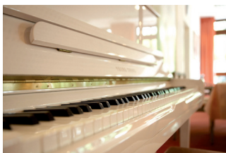
Die Residenz lädt regelmäßig zur „Haus“-Musik.